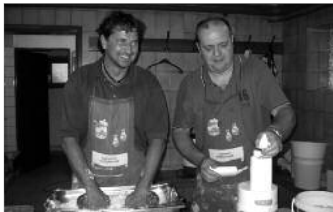
Quotenmänner! Gleichberechtigung gilt erst recht im Turnverein!