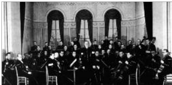
Das 1952 von Theo Koning gegründete „Symphonie-Orchester der Saarbergwerke“ bei einem Konzert im gleichen Jahr im Belegschaftsheim Klinkenthal.

Quellen: Balzer, L.K.: Saarlouis 1964. Der Bergmannsfreund (mehrere Jge.) – Hahn, R.: (1) Die Saarbrücker Militärmusik. Saarbrücken 1967. – (2) Die saarländische Bergmusik. Die Bergkapellen. Saarbrücken 1969. – Margeit, I.: Die Bergkapellen und der Saarknappenchor. Saarbrücker 1951.