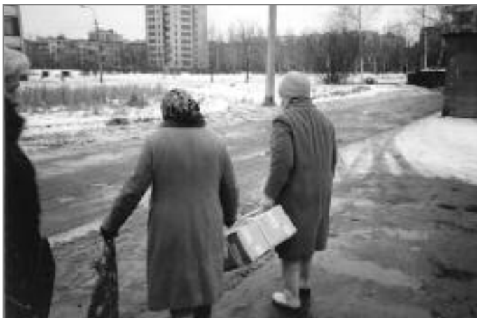
Zwei Frauen, die ein Paket nach Hause tragen