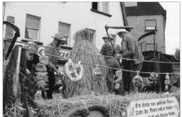
„Vom Korn zum Brot“ nennt die Behindertensportgruppe ihren Motivwagen: Eine Erinnerung an das Bergmannsbauerndorf Schiffweiler.

Nicht erwähnt wird im Goldenen Buch der eigentliche Höhepunkt der 1100-Jahrfeier, der historische Festumzug an Pfingstsonntag, der der Festveranstaltung vorausging: „1100 Jahre Schiffweiler. Glanzvoller Höhepunkt der Festivitäten: Der historische Umzug. Bunte, prächtig geschmückte Motivwagen, Fußgruppen und Fanfarenzüge gaben nicht nur ein Bild des aktuellen Vereinslebens wieder, sie ließen auch die Geschichte der Bergmannsgemeinde wieder lebendig werden. Tausende Zuschauer aus dem gesamten Saarland genossen trotz des regnerischen Wetters die bunte Präsentation der Gemeinde,“ so schreibt der Reporter der Saarbrücker Zeitung, Michael Rennig, am 1. Juni 1993.