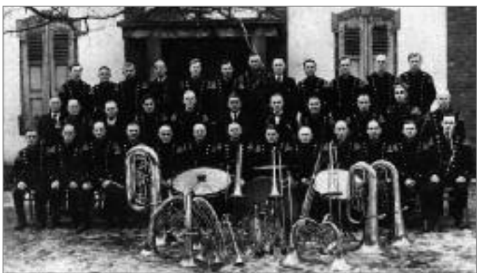
Die Bergkapelle Reden um 1950 vor dem Südeingang des Belegschaftsheimes Klinkenthal.