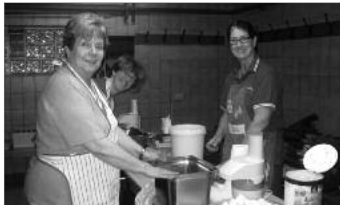
Alt bewährtes Team, die Turnfrauen des TVH!

Danke an die, die bei Regen und Wind auf- und auch wieder abgebaut haben. Danke an alle, die nahezu 300kg Kartoffeln gerappt und verarbeitet haben. Danke an alle, die mit ihrem Dienst zum Gelingen des Festes beigetragen haben. Danke an das Wildgulaschkochteam. Danke an alle, die uns mit Kuchen Spenden unterstützt haben. Danke an alle, die im Vorfeld uns bei der Planung unterstützt haben. Danke an all unsere Besuchern, die trotz Regen den Weg zu uns gefunden haben und mit den wir schöne Stunden verbracht haben. Ein besonderes Dankeschön geht an alle, die wir hier vergessen haben, separat zu nennen.