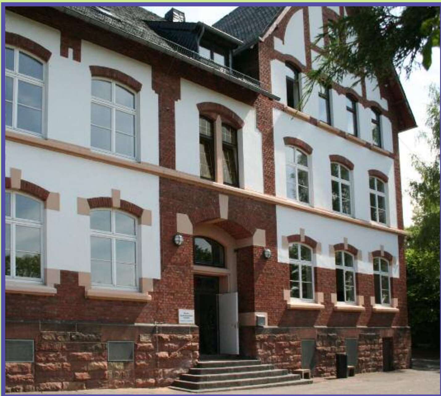
Private Kaufmännische Schulen • Itzenplitzstraße 26 in Heiligenwald

Der Gemeindebezirke: Heiligenwald, Landsweiler-Reden, Schiffweiler und Stenweiler unabhängig • überparteilich • regional 7. Jahrg. • Nr. 77 • Juni 2011 www.unser-blaettsche.de • www.veith-design.de