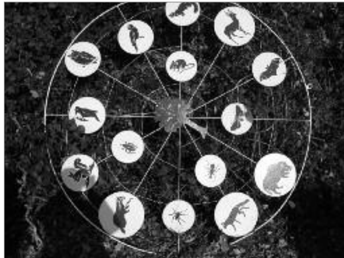
Alles in der Natur ist miteinander verbunden