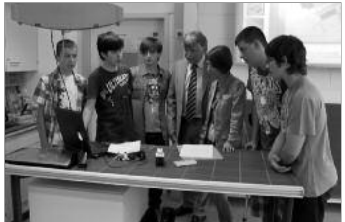
Das Bild zeigt die Schüler bei der Präsentation