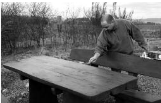
10 Bänke zum ausruhen