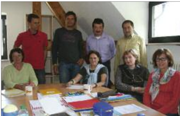
Das Kollegium der Privaten Kaufmännischen Schulen in Heiligenwald

Telefonisch ist die Schule unter 0 68 21 / 2 70 25 erreichbar. Im Internet finden Sie die Privaten Kaufmännischen Schulen unter www.privatekaufmaennischeschulen.de .