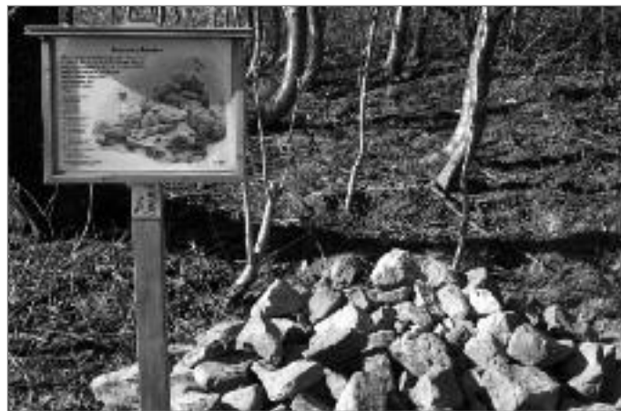
Optimaler Lebensraum für viele Tiere