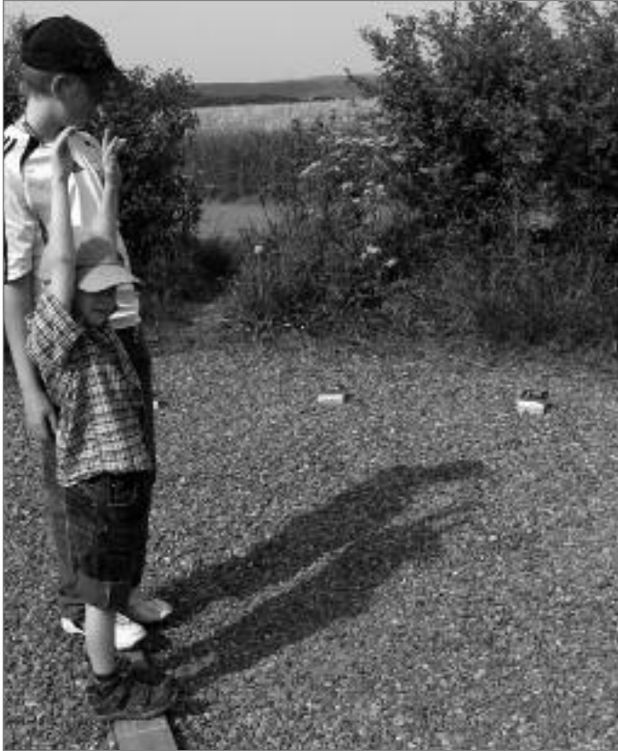
Sonnenuhr: der Schatten zeigt auf die richtige Uhrzeit