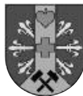
Das neue Gemeindewappen

1976 Verleihung des Gemeindewappens mit Festakt im Lokal Scherer, am 25. November. Das Wappen wurde von dem Heraldiker Alois M. Peter wie folgt beschrieben: „In Blau das goldene Lilienhaspel-Glewenrad, überzogen mit silbernem Göpelstück, darin ein grünes Lindenblatt, ein grünes schwebendes Balkenkreuz und schwarze gekreuzte Hammer und Schlägel.“ Die neuen Farben der Gemeinde sind Blau-Weiß.