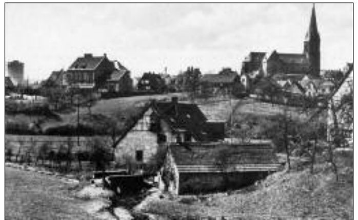
Die Klinkenmühle, eine Idylle im Fahrbachtal

Das Mühlrad wurde vom Wasser des Fahrbachs und – über einen Mühlengraben- vom Mühlbach gespeist. Ihren Namen hat die Klinkenmühle nach der Bezeichnung für die Flur erhalten, auf der sie errichtet wurde: Der Flurname „an der Klinkchen“ ist schon 1609 belegt. Seit 1590 soll die Mühle von der aus Tirol eingewanderten Familie Strauß als „gräfliche Erbleihmühle“ bewirtschaftet worden sein. Bis 1913 bleibt die Mühle im Familienbesitz und wird dann an die Grube Reden verkauft. Der Müller Edinger pachtet die Mühle und führt sie, als der Mühlenbetrieb schließlich um 1940 wegen der Grubensenkungen eingestellt werden musste, als Bauernhof bis 1948 weiter. Als Wohnhaus diente sie noch lange Familie Alles. Dann brannte die Scheune nieder, Familie Alles verließ die Mühle, das leer stehende Gebäude verfiel nach und nach – und wurde 1976 abgerissen.