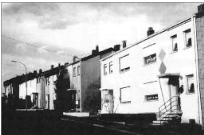
Blick in die Ringstraße