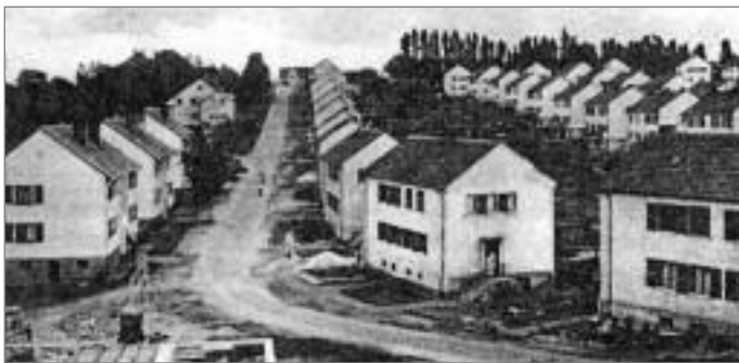
Blick auf Schiffweilerstraße und St. Barbara-Straße

Schon 1949 hatten Belegschaftsmitglieder der Grube Reden diesen Gedanken aufgegriffen, und nach der Lösung verschiedener Anfangsprobleme konnten sie am 6. Januar 1952 zur Gründungsversammlung der „Bauinteressengemeinschaft der Bergleute von Heiligenwald und Landsweiler-Reden“ ins Bergmannsheim Klinkenthal einladen. 1953 nahmen die Mitglieder der BIG die Arbeit an der Schiffweilerstraße in Heiligenwald auf – fünf Jahre später, am 18. August 1958 konnte der vorläufige Abschluss des Unternehmens „BIG Heiligenwald-Landsweiler-Reden“ gefeiert werden: 116 Wohneinheiten waren in der Schiffweilerstraße, in der Barbarastraße, im Pappelweg, der Ulmen- und Fichtenstraße in harter Arbeit von den Bauwilligen geschaffen worden.