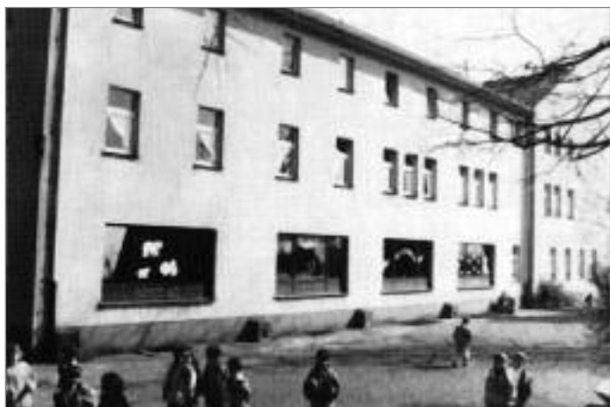
Im Jahr 2004 zog der Kindergarten St. Martin von hier aus um in das neue Pfarrheim in der Parkstraße