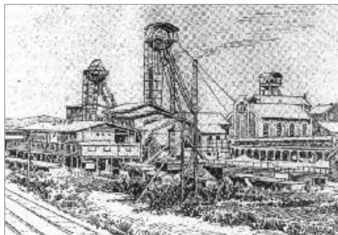
Die Grube Reden um 1920

Als 1920 die „Mines Domaniales Francaises du bassin de la Sarre“ das Bergwerk übernahm, kam es zu einer 15-jährigen Stagnation bei Entwicklung und Modernisierung.