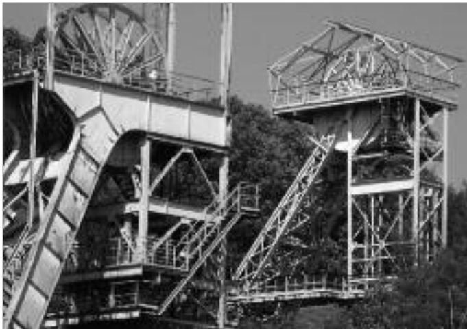
Itzenplitz Grube-Fördergerüst Schacht II und III

Bilder zu diesen Funden sind selten, jedoch werden einige gezeigt werden. Aus späteren Zeiten finden sich Anzeichen auf Straßen die unsere Gemarkung durchzogen Sie sind ebenfalls Teil dieses Vortrags. Funde gibt es bis zum Mittelalter. Wo die Menschen in dieser Zeit wohnten können wir belegen und darstellen. Der Kostenbeitrag beträgt 3 Euro