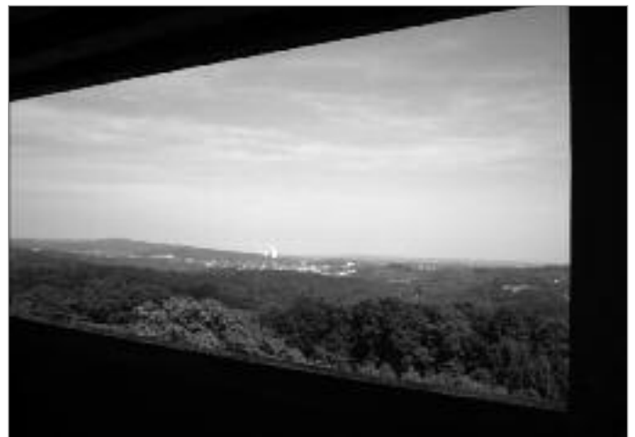
Bildstock-Blick vom Hoferkopfturm über den Saarkohlenwald nach Neunkirchen