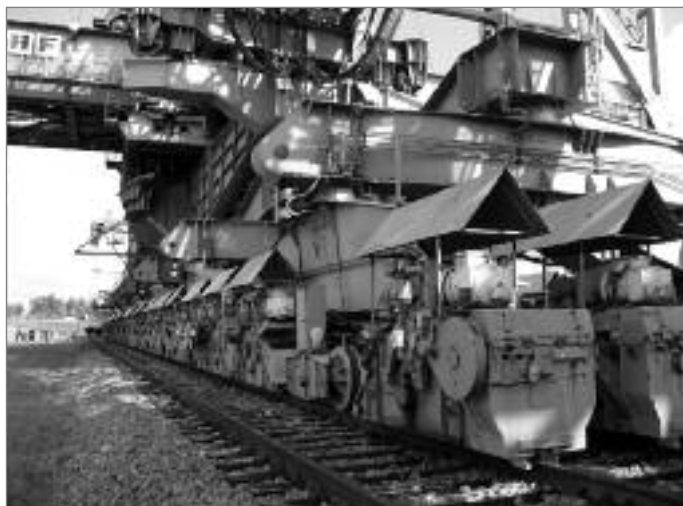
Der Mittelteil der beweglichen Technik-Anlage F 60, von dem die Abraumförderbrücken ausgehen.