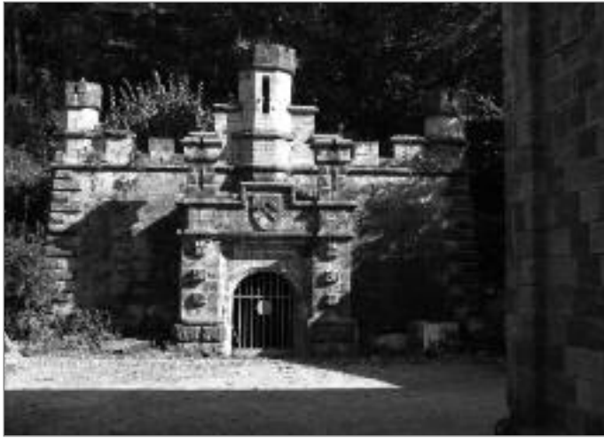
Von der Heydt - Stollenmundlocharchitektur von 1875

30. September möglich, Herr Bendzulla informiert auch gerne über die Teilnahmegebühr und gibt weitere organisatorische Hinweise. Lassen Sie sich also überraschen – ein starkes und typisches Stück Saarland erwartet Sie! Und die Exkursion behandelt eine für das Saarland sehr aktuelle Thematik.