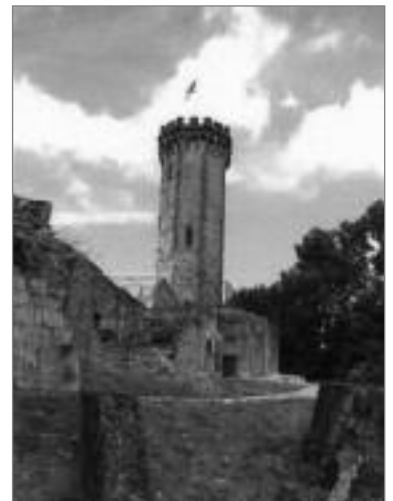
Der 1891 von Tornow restaurierte Turm des 1315 von Louis XIII erbauten Forbacher Schlosses.

„So ruht er nun in dieser moselländischen Erde, der er sein reiches Erbe hinterlassen hat, dem Land, das er so geliebt hat und nie verlassen wollte.“ (Hilbold, A. u.a., 2011)