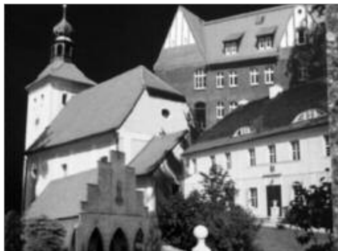
Fotomontage: Welzow auf einen Blick (Gestaltung: Regia Verlag)

Auch die Glashütten, die den im Abraum der Braunkohle-Lagerstätten enthaltenen feinen Glas-Sand verarbeiteten, existieren nicht mehr.